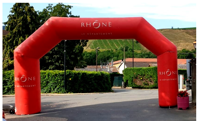
Sur la Route du Tour, Le Perréon