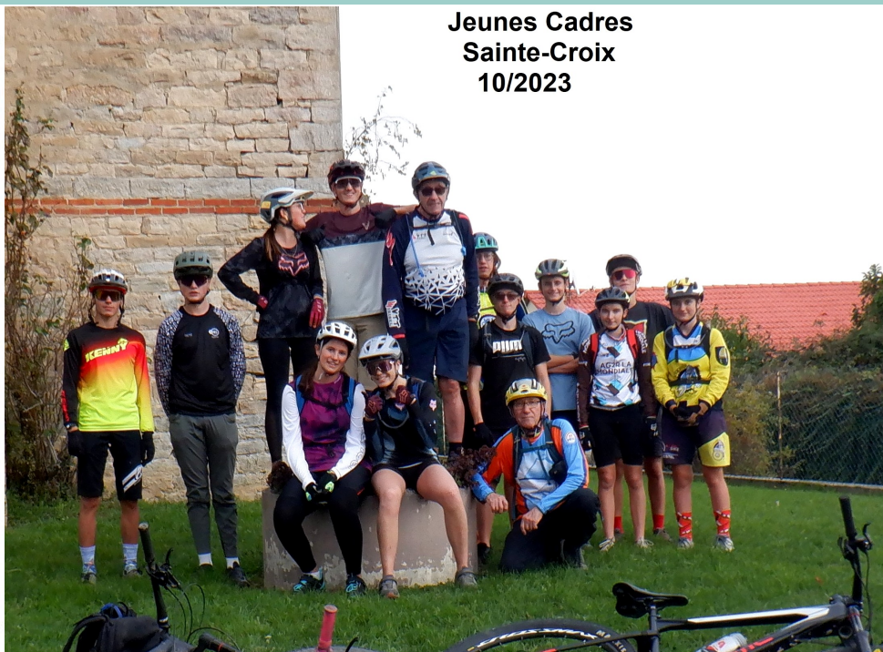
Jeunes Cadres Sainte-Croix 10/2023