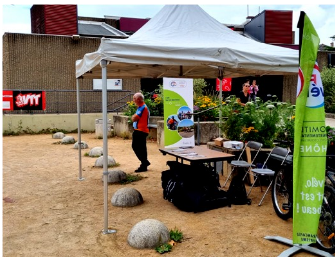
Fête du vélo à Neuville Sur Saône