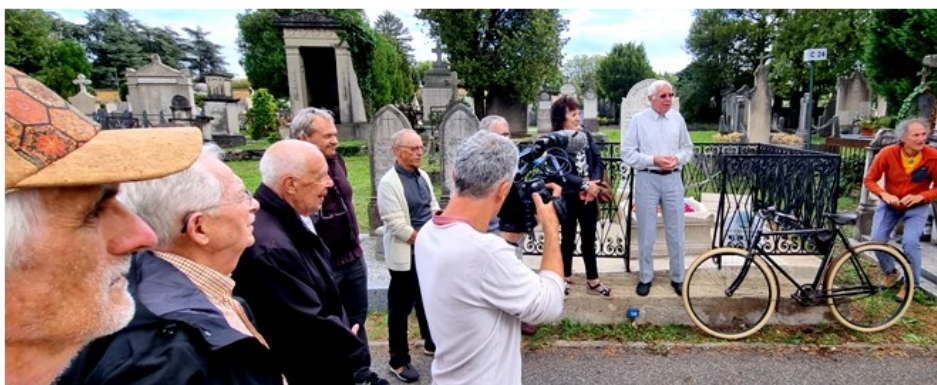
Commémoration Vélocio, cimetière de Loyasse